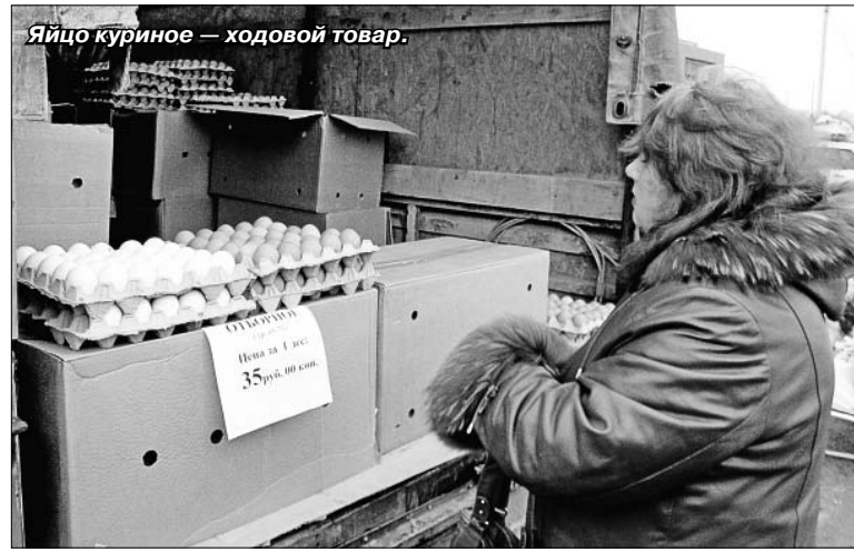
Яйцо куриное — ходовой товар.