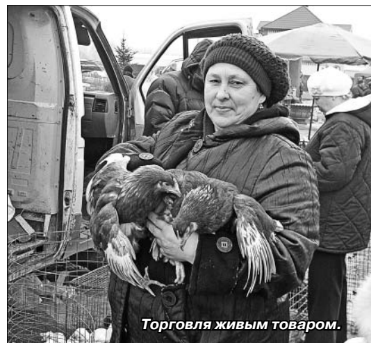
Торговля живым товаром.

Живой товар — кролики, суточные цыплята и куры-несушки — вызывал особый интерес. Пополнить свой птичий двор — самая пора. Поэтому здесь больше всего было желающих приобрести живность. Метла, лопаты, ведра, грабли, лейки и многое другое также были