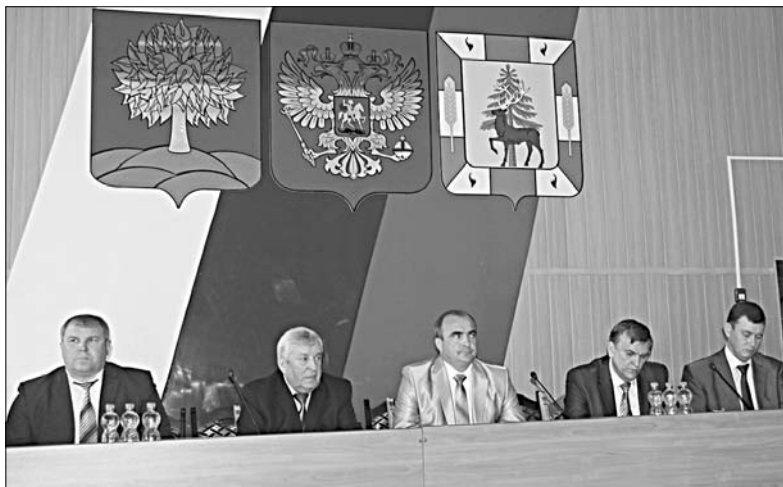
В президиуме первой сессии районного Совета депутатов.