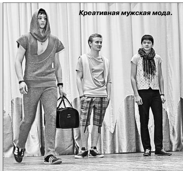
Креативная мужская мода.