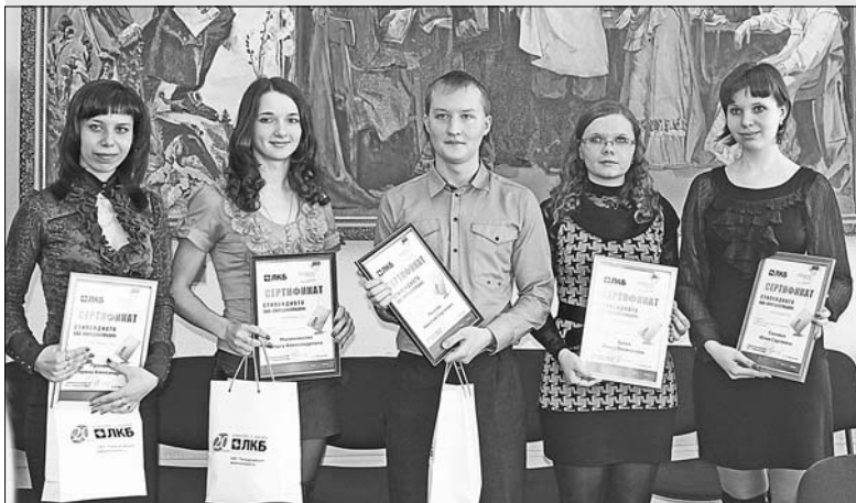
Лучшие студенты экономического факультета ЕГУ им. И. Бунина.