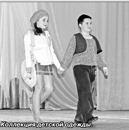
Коллекция детской одежды.

Здесь было представлено 12 коллекций и презентаций дипломных проектов выпускников специальности дизайн костюма. Красочность, креатив, современный дизайн каждой представленной модели отметили все, кто пришел поучаствовать в шоу.