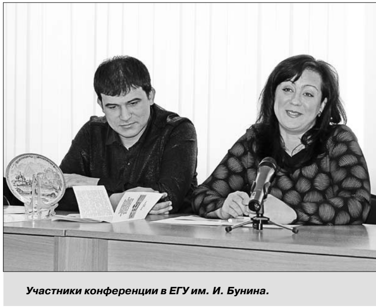
Участники конференции в ЕГУ им. И. Бунина.