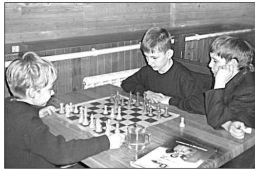
Каждый ход требует внимания.