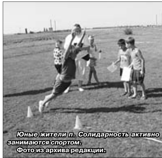
Юные жители п. Солидарность активно занимаются спортом.

В нашей школе организованы оборонно-спортивные, кадетские классы и предусматривается как бы продолжение физкультуры во внеурочное время.