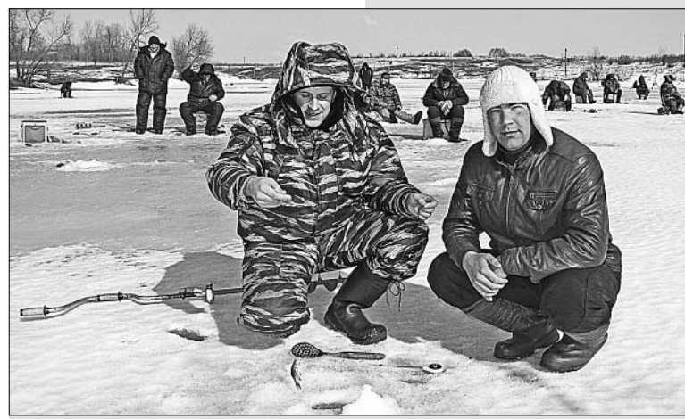
Ловись, рыбка, большая и маленькая!