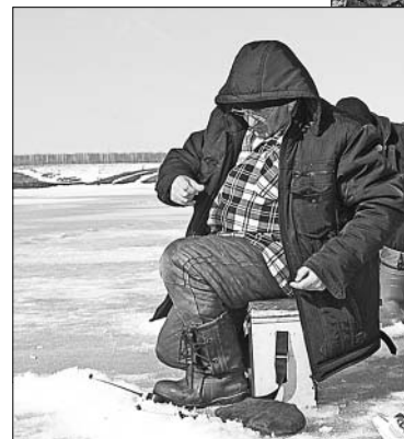
Терпение и труд — и будет улов!