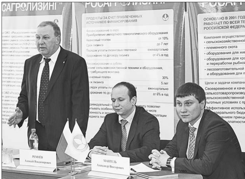
Представители ОАО «Росагролизинг» беседуют с аграриями.

Приоритетным направлением их деятельности стала поставка сельскохозяйственной техники и оборудования российским сельхозтоваропроизводителям в регионах. Кроме того, компания работает с достаточно широким спектром новых программ. Подробно остановились