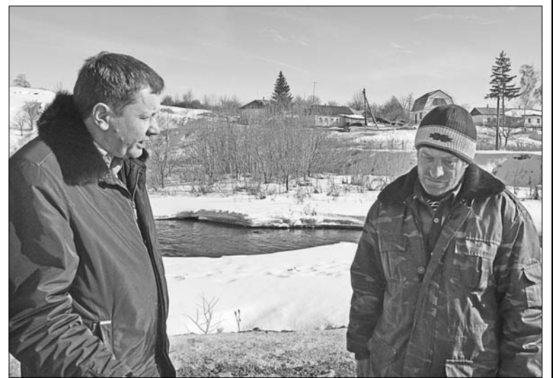
Разговор с главой — откровенный.

привязывать собаку как-то неприлично. И это все потому, что пока ни к одному жителю не применяли строгих административных мер.