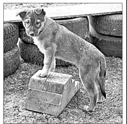
Собака — друг человека?

Но никто не может согласиться с тем, что жить в деревне и