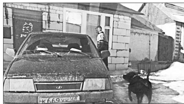
Питбуль идет за хозяином неохотно.