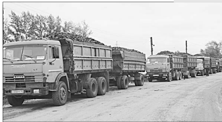
Колонна груженых сахарной свеклой автомобилей в очереди к приемочному пункту.