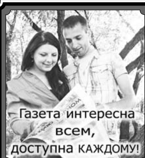
Газета интересна всем, доступна КАЖДОМУ!

Имя защитника рубежей России и покровителя воинов известно далеко за пределами нашей Родины. Свидетельство тому — многочисленные храмы, посвященные святому Александру Невскому.