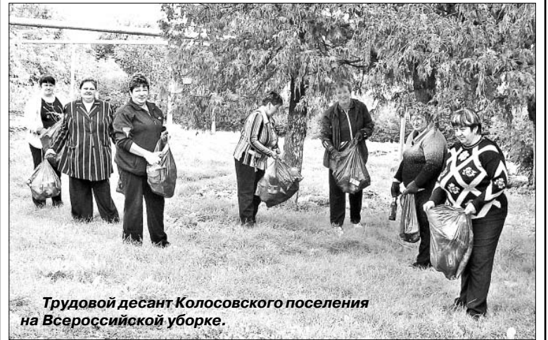
Трудовой десант Колосовского поселения на Всероссийской уборке.

Субботним утром (день начала акции в нашем регионе) трудовой десант вышел на сельские улицы, чтобы навести чистоту. В состав этой бригады