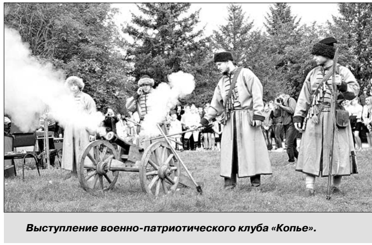
Выступление военно-патриотического клуба «Копье».