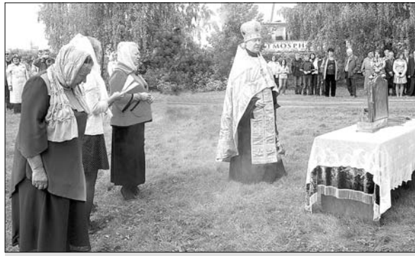
Заупокойная лития у храма Петра и Павла.

государства. И в войне 1812 года ельчане принимали непосредственное участие. Во время Бородинского сражения Елецкий пехотный полк