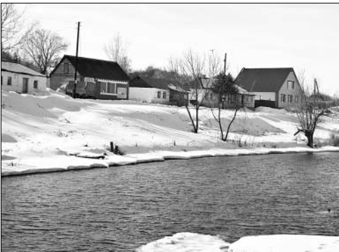
Река Паленка в Аргамач-Пальне сегодня несет свои воды в берегах. А что будет через неделю?

Вот и пришло настоящее тепло. По утрам зима не сдаётся, но к обеду звенит, не умолкая, капель. Снег оседает, первые ручьи сбегают в реки.