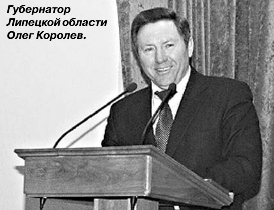
Губернатор Липецкой области Олег Королев.