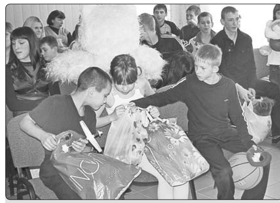
Подарки воспитанникам детского дома.

В марафоне добрых дел участвовали представители органов власти и местного самоуправления, трудовых коллективов, общественных организаций, Липецкой и Елецкой епархии, образовательных учреждений, а также жители региона.