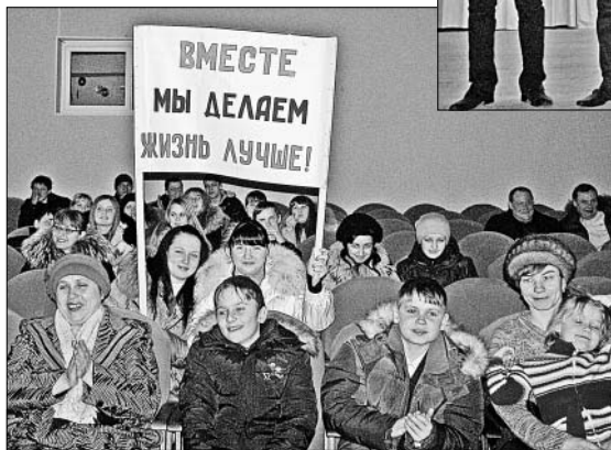
Группа поддержки из зала.

столицей Российской Федерации? будет ли в этом году конец све-