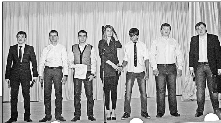
Выступает команда КВН «Соседи».

Среди молодежной аудитории нельзя было не заметить и людей