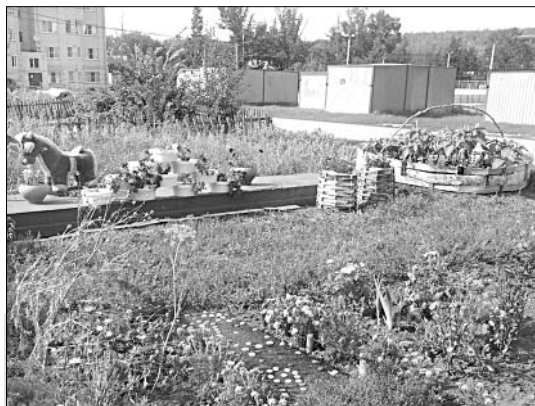
Вот такой «оазис» появился у дома № 21 в поселке Газопровод благодаря стараниям самих жителей.