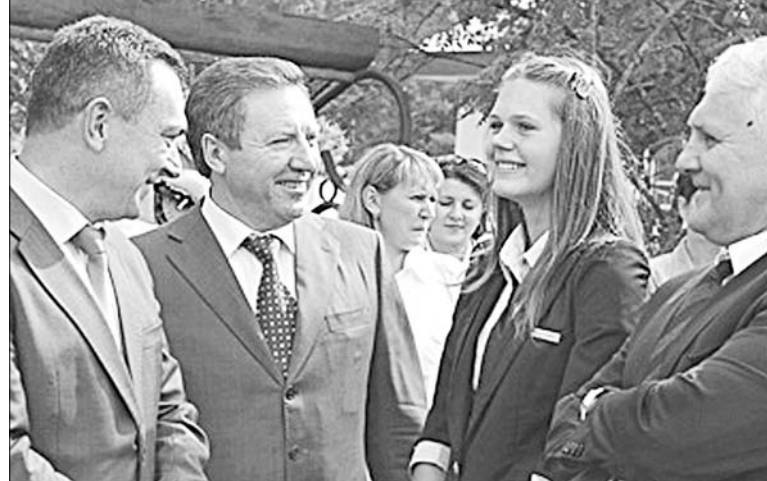
Глава региона О. Королев вел диалог со старшеклассниками из Амурской области.

В нашем районе, как и по всей стране, идет сбор средств и вещей для пострадавших в результате стихийного бедствия.