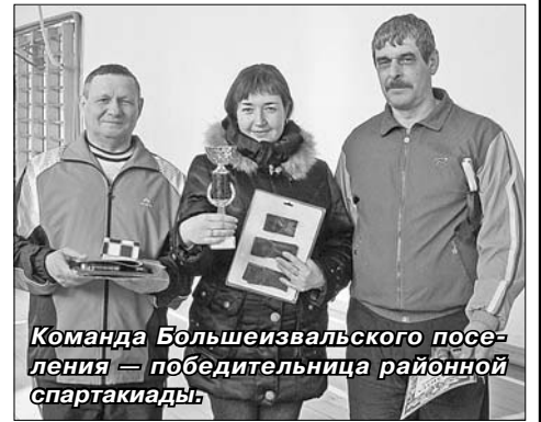
Команда Большеизвальского поселения — победительница районной спартакиады.

В соревнованиях шашки эмоции били через край как у участников, так и у их бо-