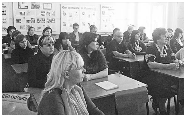
Участники «круглого стола» в школе п. Ключ жизни.