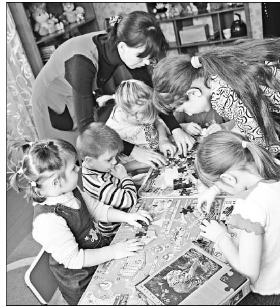
«Ковчег» для многих воспитанников стал вторым домом.