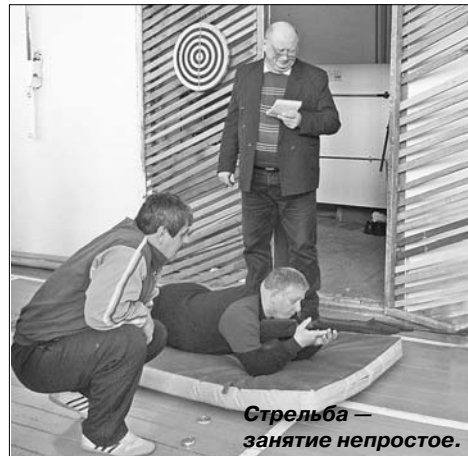
Стрельба — занятие непростое.

Вторым испытанием стал дартс. Тут тоже меткость, сноровка нужны. Волнению здесь