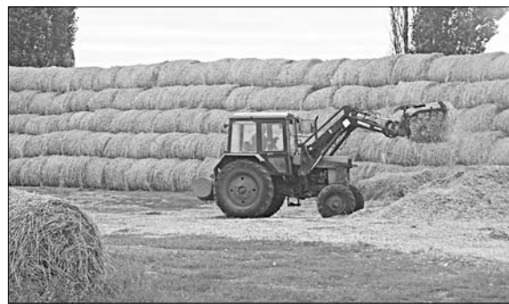
Кормов для животноводства заготовлено в достатке.

конечно, управляться с таким хозяйством, но каждый — специалист на своем месте, работу знает от «а» до «я», потому сборов не случается. К тому же условия труда улучшаются. Скажем, операторы машинного доения теперь молоко в бидонах не но-