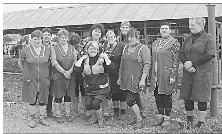
Важен общий результат, считают животноводы «Колос-Агро», потому и сфотографироваться решили всем коллективом.