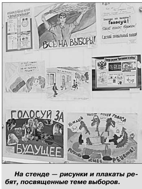
На стенде — рисунки и плакаты ребят, посвященные теме выборов.