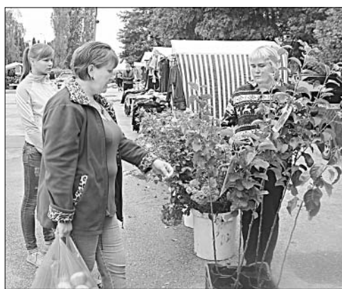
Саженцы роз привлекли внимание покупателей.