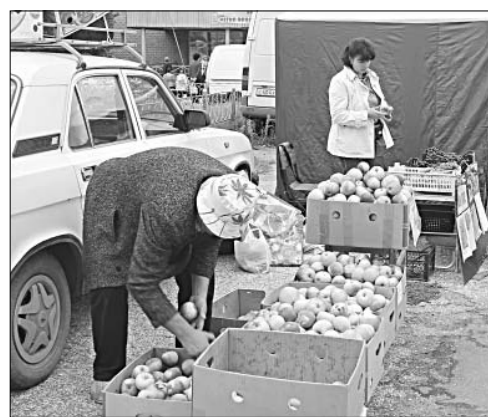
Яблоки из садов Краснинского района на ярмарке пользовались спросом.