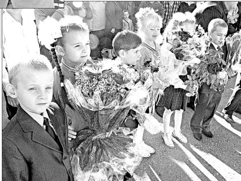
Первый раз, в первый класс.

— Очень благодарна главе за оценку нашего труда, — признается она. — Это не только душу греет, но