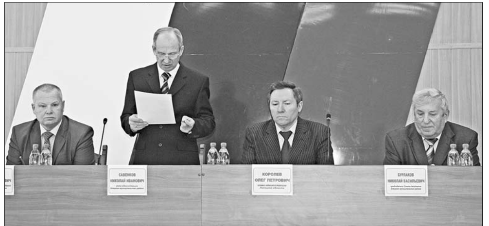
Президиум Совета администрации.

— Мы уже доказали в последние годы, что каждый человек имеет возможность позаботиться о себе сам. А власти следует