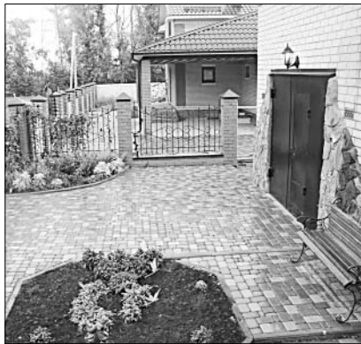
Красивый уголок ул. Пушкина.