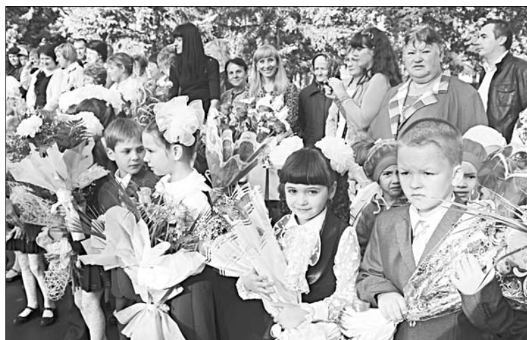
Эти ребята сегодня пошли «в первый раз в первый класс».