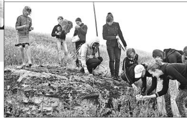
Одна из экспедиций «Таволги».

широкомасштабный из них — сравнительный анализ беспозвоночных организмов, обитающих в реках района. Объем работы немалый. Экологам предстоит изучить состояние животного мира в устьях, верхних и средних течениях рек; взять пробы воды, исследовать ее качество, температуру, цвет, запах. А значит, ребят ждут и очередные экспедиции. Также юные экологи планируют провести мониторинг численности рыбы минога, обитающей в реке Сосна. Для Липецкой области это очень редкий вид. Отдельная работа будет посвящена изучению способов и методов борьбы с корневищными сорняками.