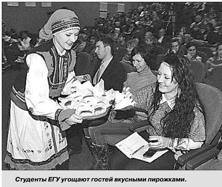
Студенты ЕГУ угощают гостей вкусными пирожками.

В память о дне подписания указа ежегодно в университете 25 января отмечается Татьянин день. С 2005 года 25 января отмечается в России как День российского студенчества.