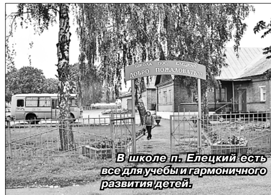
В школе п. Елецкий есть все для учебы и гармоничного развития детей.

этому относится уже по одной той причине, что либо сам состоит в этой партии, либо ее всемерно поддерживает, материально в том числе.