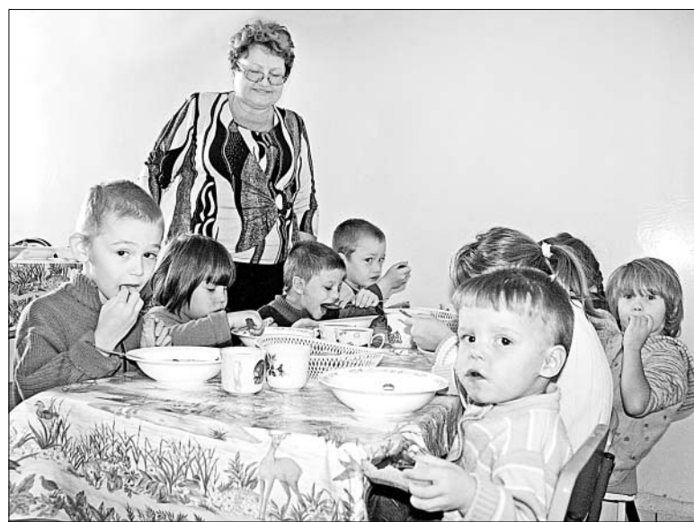
В Центре «Ковчег» дети окружены особой заботой и вниманием.

Более восьми лет назад в пустовавшем бывшем детском саду деревни Ериловка начал расти на глазах центр для маленьких, обездоленных ребятишек. Для них еще в те годы сделали все по последнему слову современного дизайна, привезли лучшие игрушки, мебель, одежду. Центр быстро прирос спортивным залом, производственной мастерской. Воспитатели сделали его оазисом добра, эстетики.