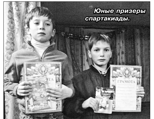
Юные призеры спартакиады.