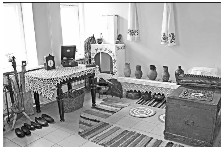
Для воспитания чувства патриотизма, изучения истории малой родины в «Ковчеге» открыли музейную комнату.

Были годы, когда Центр реабилитации «Ковчег» был «забит» до отказа детьми. Но со временем стали успешно работать многие социальные программы, нацеленные на поддержку семей,