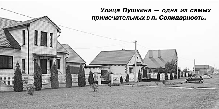
Улица Пушкина — одна из самых примечательных в п. Солидарность.