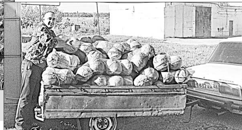
Владельцы ЛПХ и сами продукцию в «Елецкий заготовитель» доставляют.