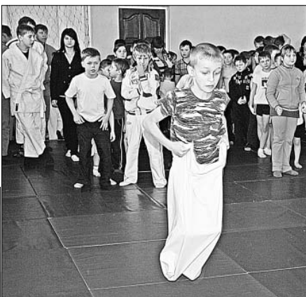
Прыжки в мешках — непростое задание.

хотели бы стать дзюдоистами, боксерами, атлетами. За занятиями ребят постарше они всегда наблюдают с интересом и, конечно же, завидуют их силе, выносливости, а еще тем наградам, которые те завоевывают на соревнованиях.