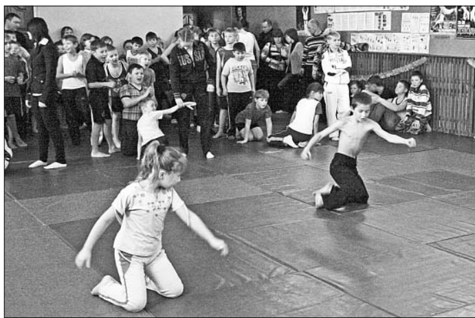
Кто быстрее доберется до финиша, тот и победитель.

Бег, прыжки в мешках, конкурсы на смекалку и координацию движений — эти состязания в рамках спортивной игры «Веселые старты» очень нравятся детворе, которая занимается в группах общефизической подготовки районной ДЮСШ. Мальчишки и девчонки знают: такие тренировки помогут в дальнейшем, ведь многие очень