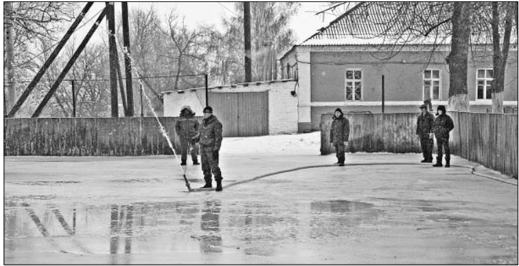
Каток в с. Лавы скоро будет готов.

Зима вступила в свои права, подкрепив их морозцем. Ребятянка прочь этим воспользоваться и погонять шайбу. Но где?