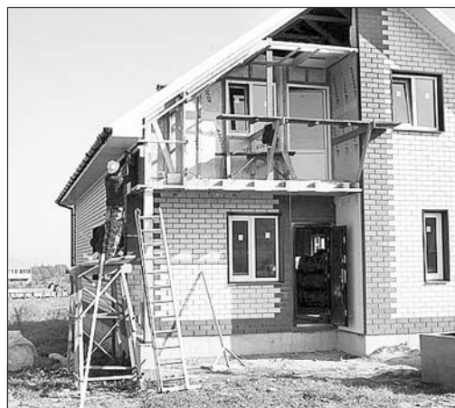
Новый дом — каждой молодой семье.

В районную администрацию поступило 18 заявлений от многодетных семей на выделение участков под строительство.