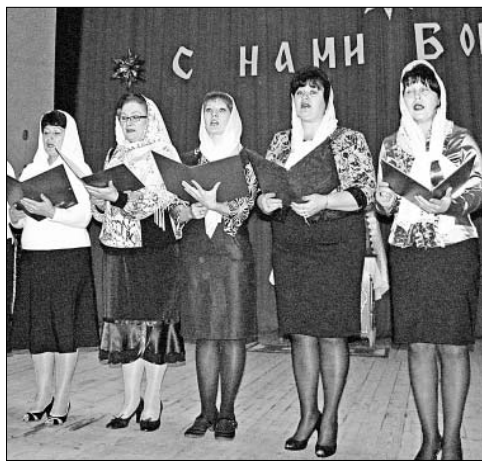
Выступает хор Казацкого дома культуры.