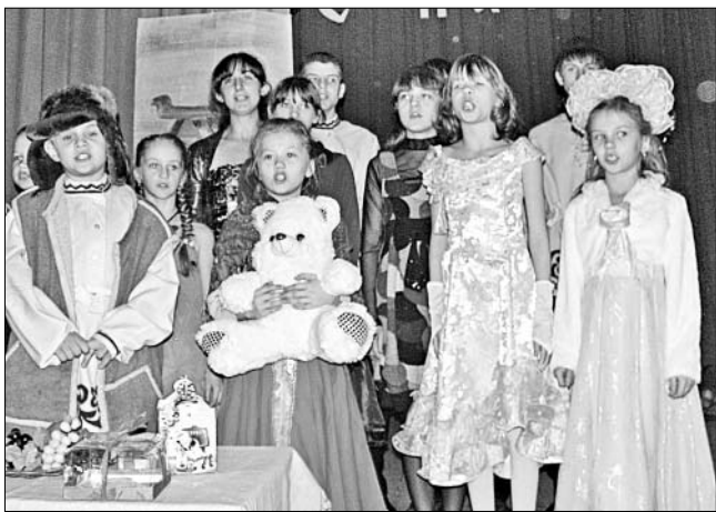
Самыми активными участниками рождественских праздников были дети.