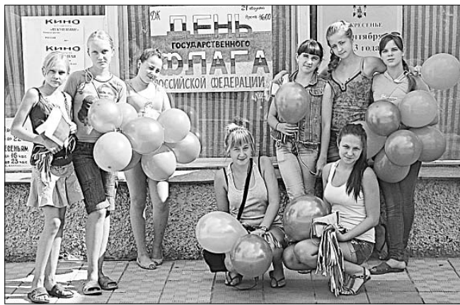
Участники акции «Отечества славного флага».