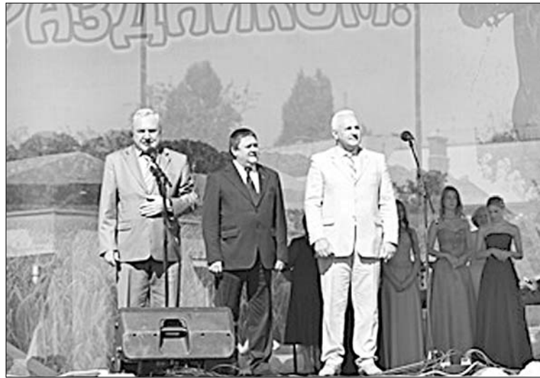
Участников праздника приветствуют руководители области.