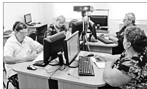
Компьютер пенсионеры осваивают с удовольствием.

Инициативные, творческие и талантливые люди старшего поколения, те, кому не сидится на месте, кто идет в ногу со временем, являются активными участниками клубов досуга для пожилых людей и инвалидов. Появились традиции проведения торжественных мероприятий по случаю праздников, юбилеев и дней рождения, организуются экскурсии по интересным и памятным местам нашего района.