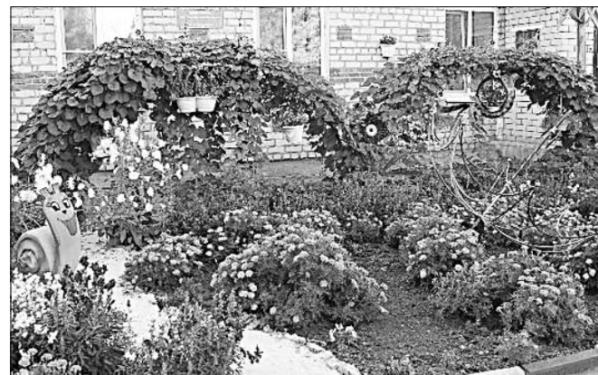
Цветочный ковер и яркие сказочные персонажи привлекают внимание всех, кто проходит мимо детского сада.

Сегодня площадку перед детским садом называют волшебной страной. Все потому, что в цветочных клумбах здесь живут сказочные персонажи птиц и животных, изготовленных родителями. А еще привлекают внимание ребят, прохожих яркие флюгеры, огромный красочный зонт. Кстати