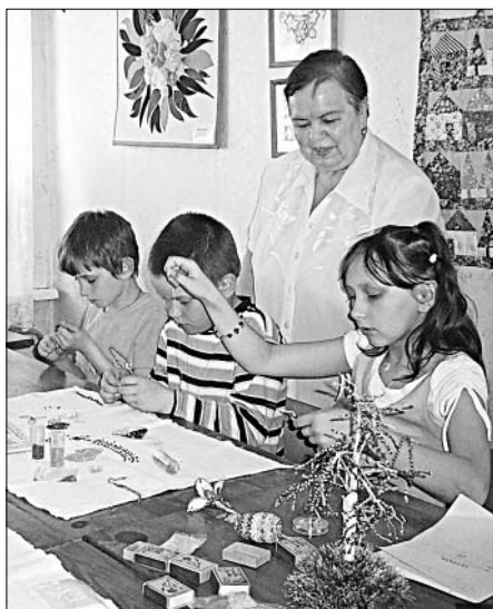
Секретами рукоделия пенсионеры охотно делятся с молодежью.

ными от жизни. Их мудрость, жизненный опыт — настоящее богатство, которое нужно беречь и радоваться тому, что оно у нас есть.