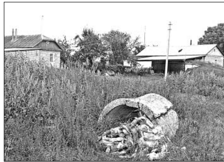
Очередная стихийная свалка.

На днях в редакции раздался тревожный телефонный звонок. Собеседница на том конце провода отказалась назвать свое имя, но рассказала о том, что происходит в ее поселке. Женщину тревожит