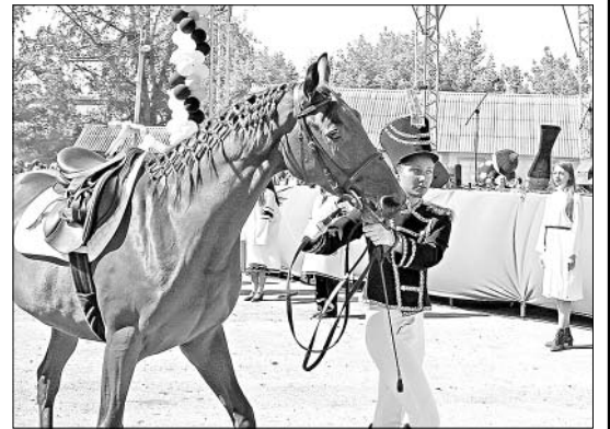
Торжественный парад открывали племенные лошади.

Пятидесятая по счету выставка — это не только праздник, но еще и хорошие уроки. Они всегда застав-