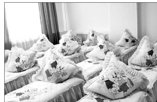
Новая спальня для ребят.