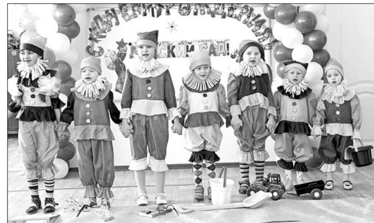
Гостей приветствуют воспитанники детского сада.