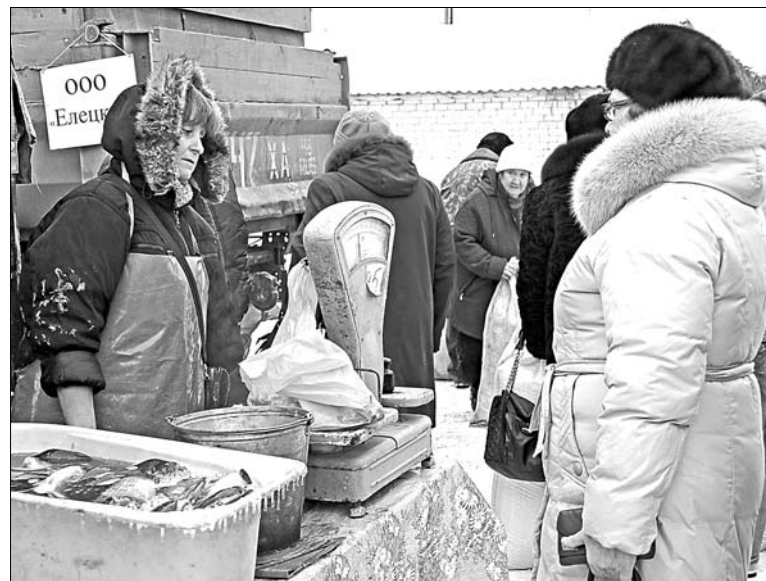
Живая рыба пользуется спросом.

для пристройки к детсаду в поселке Солидарность, возведения плавательного бассейна со спортзалом.