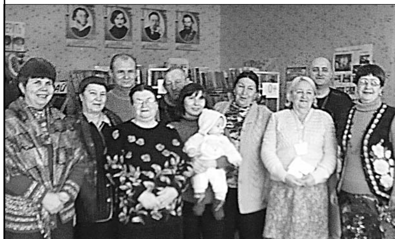
Участники встречи «Книгочей-2012» в Казинской библиотеке.