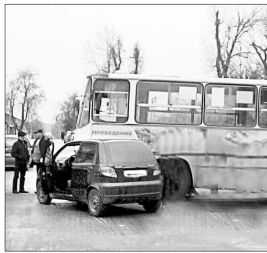
При содействии сотрудников ОГИБДД ОМВД по Елецкому району подготовила А. МИТУСОВА.

Специалисты утверждают: лучший совет по безопасному вождению в сложных зимних условиях — не садиться за руль вовсе! А еще важно не переоценивать свои способности и возможности автомобиля. Даже «асы», имеющие за плечами немалый стаж, не застрахованы от аварийной ситуации. Какой участок дороги может оказаться самым сложным, сказать трудно. Считается, что проблемы чаще всего возникают на перекрестках. Вот и этот снимок тому подтверждение. Чуть отвлекся, потерял бдительность — и произошло столкновение. Бывалый водитель скажет: здесь, даже имея приоритет, лучше убедиться, что другие участники движения адекватно оценивают дорожную обстановку. А еще не следует забывать об элементарной вежливости. Если видишь, что водитель «зевнул», ситуация и без того опасная, зачем создавать дополнительные сложности: сигналить, мигать фарами, пытаться обогнать. Не лучше ли просто притормозить, уступить дорогу?.. Кстати, в этом случае наверняка в первую очередь застрахуешь себя от нежелательных последствий.