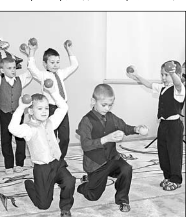
Выступление воспитанников детского сада.

Подарков было не счесть — новенькое постельное белье, подушки, одеяла, стиральная машина, цветной принтер, видеокамера, мощный пылесос, жидкокристаллический телевизор, игрушки.