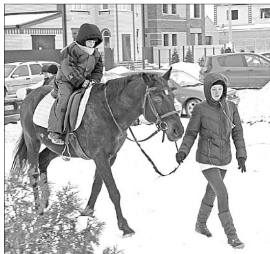
Катание на лошадях — любимая забава детворы.

Немаловажно и то, какой настрой царит во время ярмарки. Недаром она сочетает в себе и гуляния, и покупки. Тем более что нынешняя состоялась в день великого православного праздника — Крещения