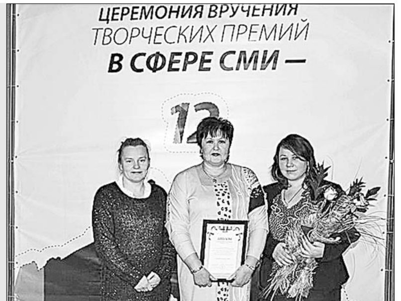
ЦЕРЕМОНИЯ ВРУЧЕНИЯ ТВОРЧЕСКИХ ПРЕМИЙ В СФЕРЕ СМИ —

Погода продолжает преподносить селянам неприятные сюрпризы. За окном морозы сменяются кратковременной оттепелью. Непостоянство температуры серьезно сказывается на результатах животноводческих хозяйств района. Коровы моментально реагируют на изменчивую погоду, что сказывается на их продуктивности. Елецкие животноводы прилагают все усилия, чтобы производительность по надоям молока не снижалась по сравнению с тем же периодом прошлого года.